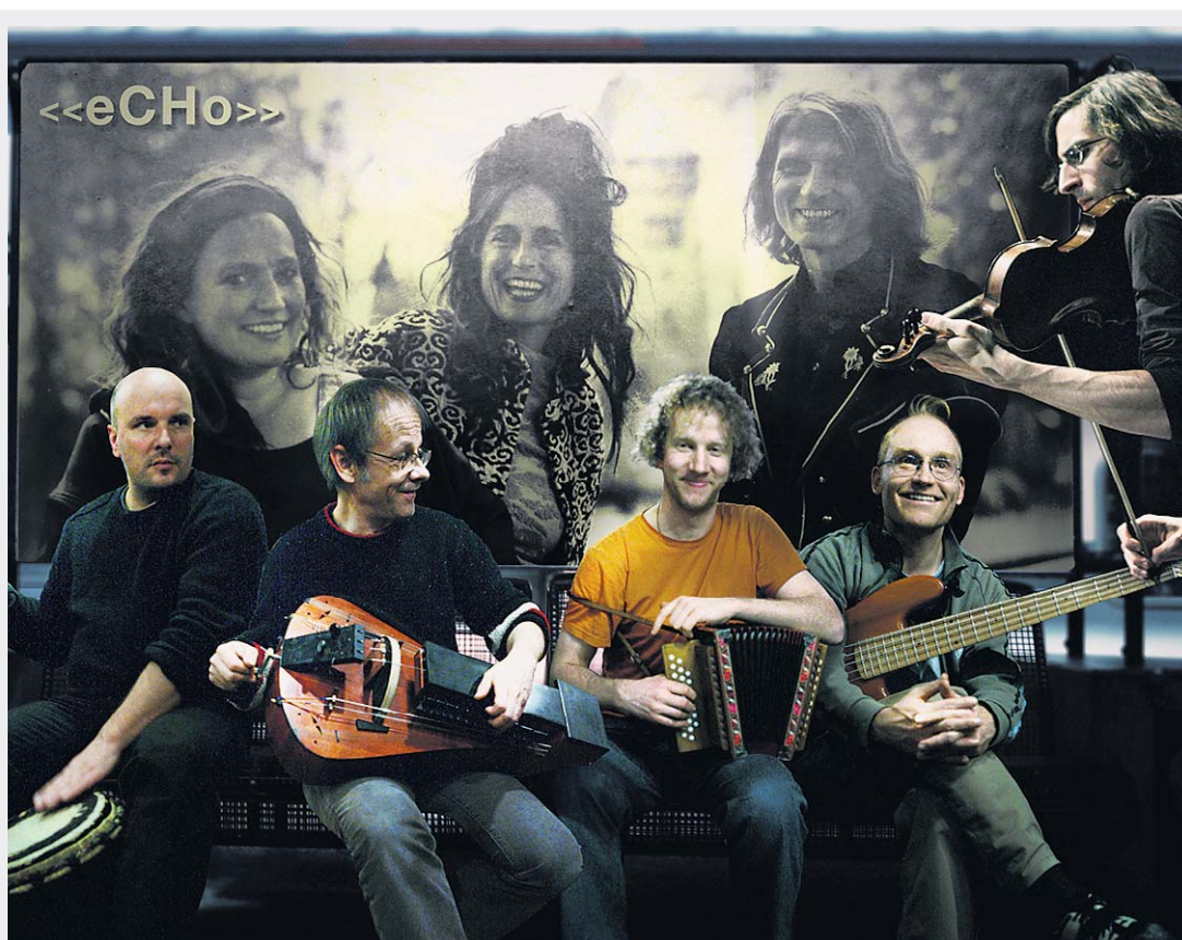
Konzert der Band eCho mit wunderbarem Gesangstrio im Scala Wetzikon.