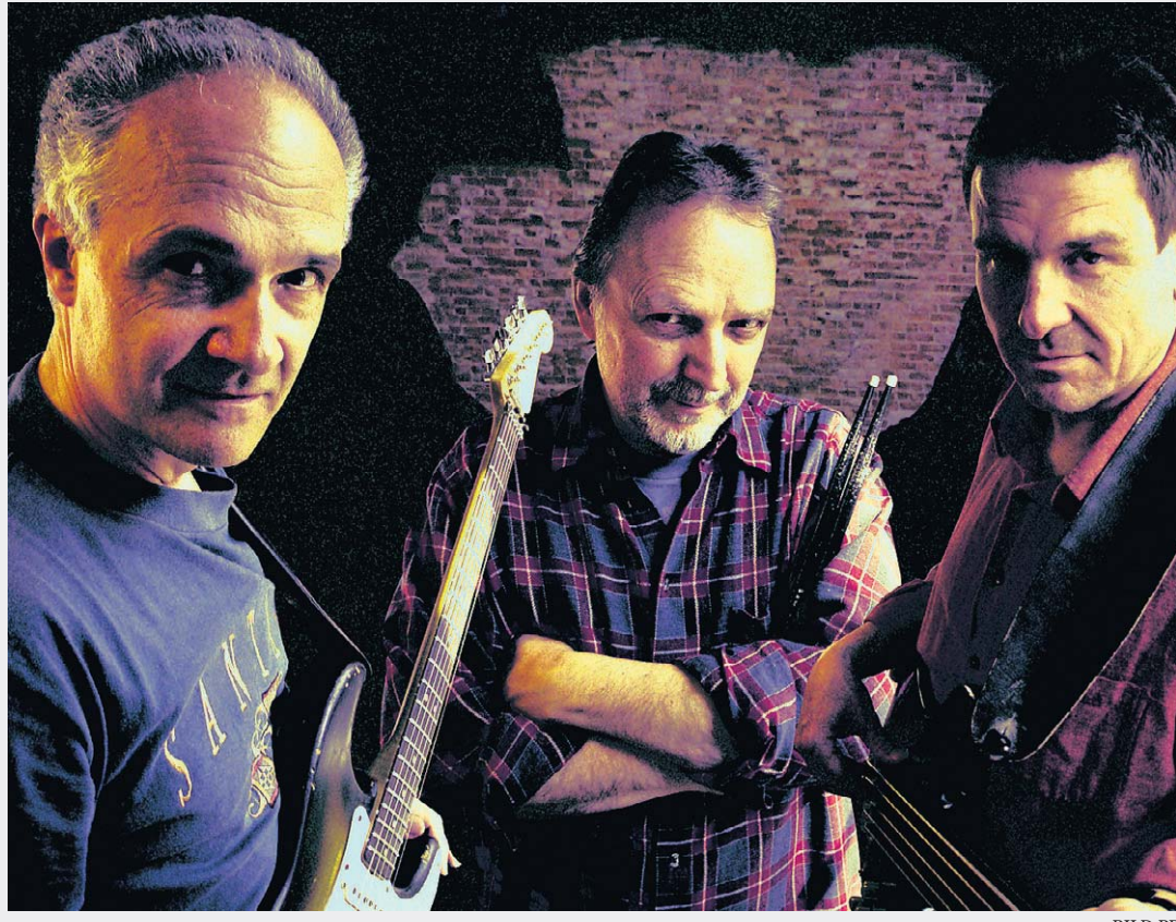
Die Band Smile lässt am Konzert im Scala etliche Gassenhauer der härteren Liga aufleben.

Apotheke Bellevue 044 266 62 22 365 Tage 24 Stunden geöffnet